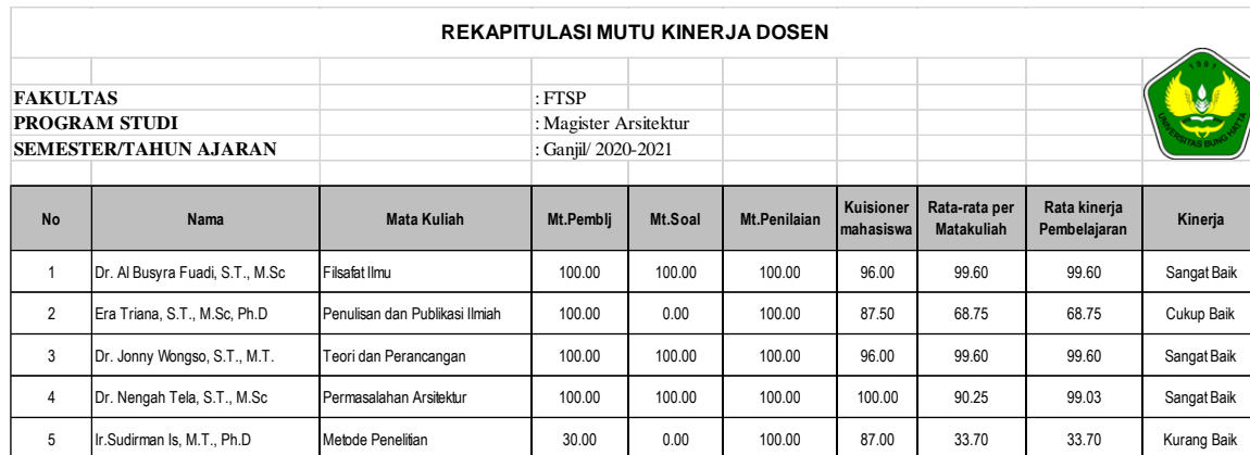
Tabel 1. Rekapitulasi Mutu Kinerja Dosen Prodi Magister Arsitektur-TA2020.1

Sumber: Hasil pengolahan data GKMf Prodi Magister Arsitektur - TA 2020.1